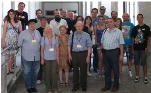
Fotado en Eskorialo dum 70a Kongreso de Hispana E-Federacio 28.6/ 2.7