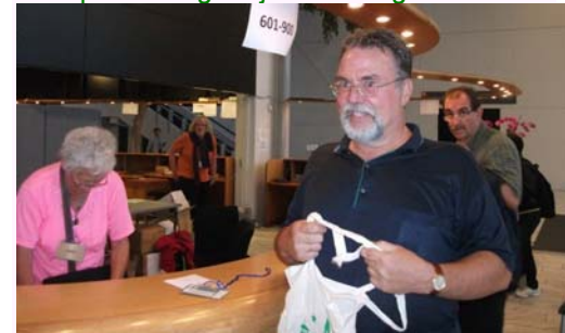
Prezidanto Tsirimokos registriĝante en UK