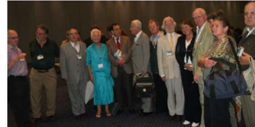
Grupo de belganoj dum inaŭguro de UK