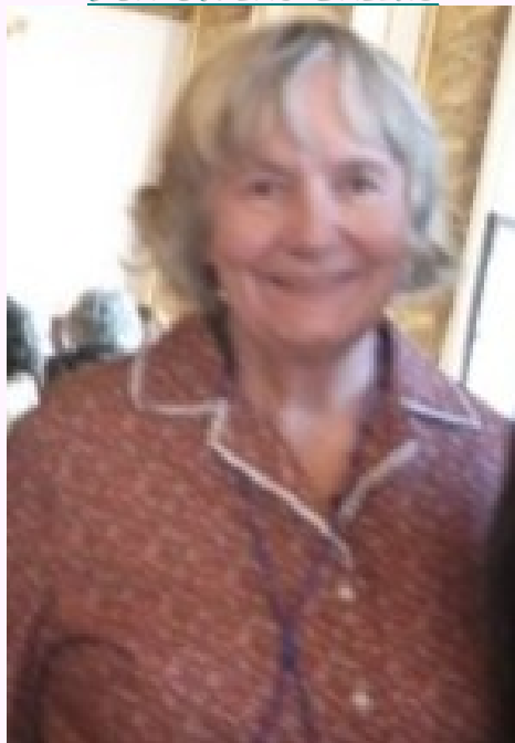
Saliko fotita de la redaktoro dum UK

Ĉiun UKon antaŭas grandegaj faka organizado kaj sindediĉa libervola laboro, kiu daŭras ankaŭ post la evento. Por la kongresanoj tamen la UK estas festo unusemajna. Ili elektas el la vasta oferto tion, kion ili deziras kaj povas digesti kaj enmeti en sian propran horaron. Neniu kapablas plene profiti kaj elĉerpi la programon. Multon vi vidos ĉe < http://esperanto.com/uk2011 >, kie aperas ekzemple la 6 numeroj de la Kongresa kuriero "Vikinga Voĉo". Tie vi legu