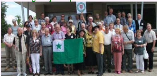
Fotado dum 47aj Baltiaj Esperantaj Tagoj