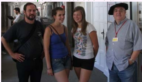
Belganoj kun prezidanto de HEF