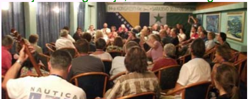
En Sarajeva Hotelo Terme, 30.7/6.8