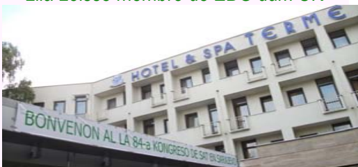
Sarajeva Kongresejo, 84a SAT Kongreso