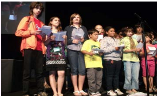
Infana Kongreseto kantas dum fermo