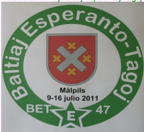
Ŝildo de 47aj BET, 9-16 Julio