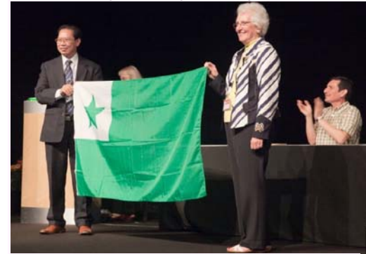
Fermo de 96a UK de UEA, 23-30/7