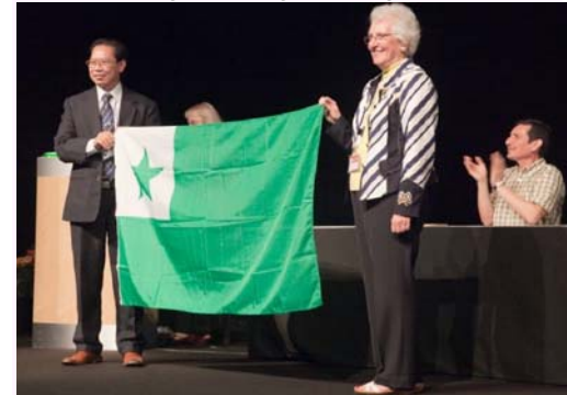
Fermo de 96a UK de UEA, 23-30/7