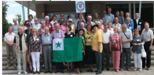
Fotado dum 47aj Baltiaj Esperantaj Tagoj