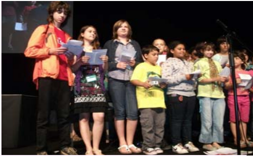
Infana Kongreseto kantas dum fermo