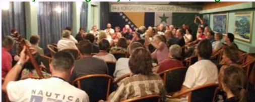
En Sarajeva Hotelo Terme, 30.7/6.8