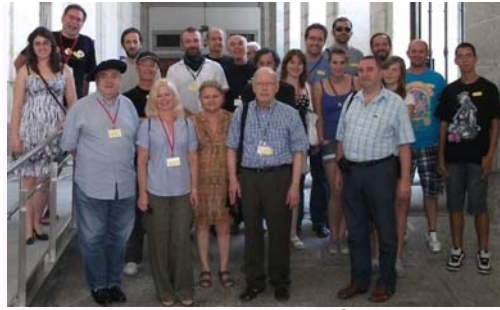
Fotado en Eskorialo dum 70a Kongreso de Hispana E-Federacio 28.6/ 2.7