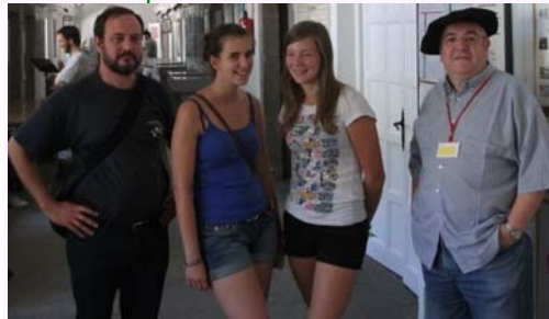
Belganoj kun prezidanto de HEF