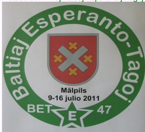
Ŝildo de 47aj BET, 9-16 Julio