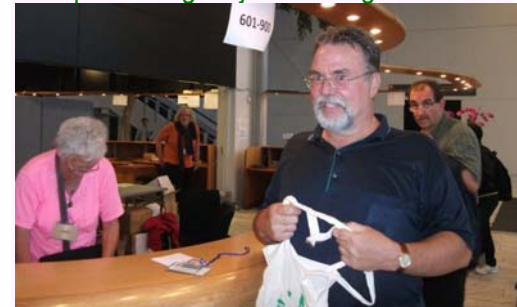
Prezidanto Tsirimokos registriĝante en UK