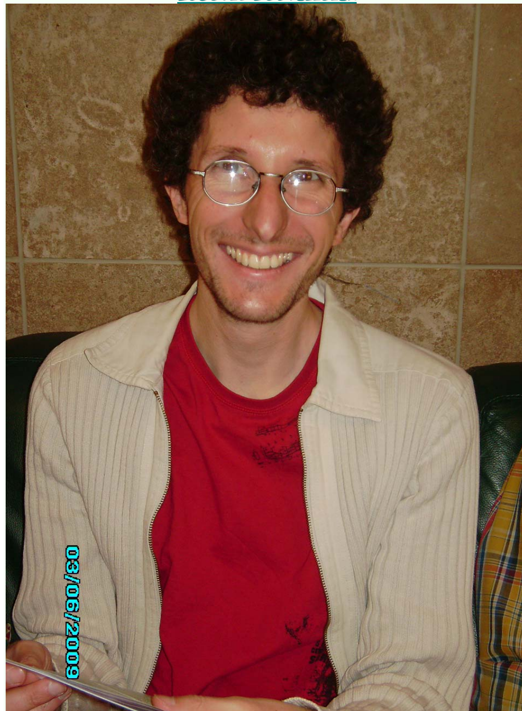
Lerninto kaj membro de Esperantista Brusela Grupo