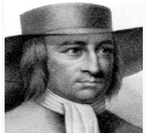
George Fox helpis fondi la Religian Societon de Amikoj en 1652. Nuntempe ekzistas ĉirkaŭ laŭreligie 300.000 kvakerojn tra la mondo

Kvakerismo aŭ Religia Societo de Amikoj) estas religia movado fondita de George Fox en la 17a jarcento en Anglujo. Ĝi radikas en kristanismo, sed krevigis la limojn de ties tradiciaj dogmoj. Ĝiaj anoj kredas ke dia revelacio povas okazi ĉiam kaj ĉie.