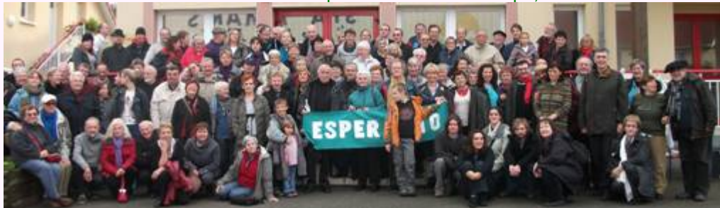
140 partoprenantoj en la 22a Nordfranca E-Rendevuo, 13-14/11/2010 Stella-Plage