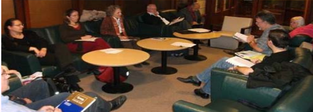
Asemblea Jarkunveno de Esperantista Brusela Grupo, 10/11/2010