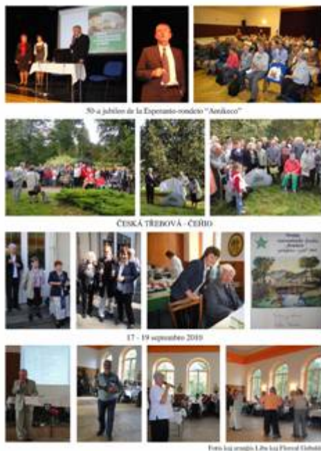
50-a jubileo de la Esperanto-rondeto "Amikeco"

urboj, inter kiuj 15 eksterlandanoj el 5 landoj: Aŭstrio, Danio, Francio, Germanio kaj Nederlando.